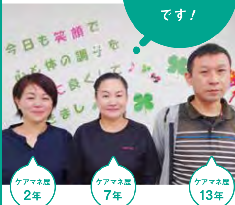
ケアマネ歴 2年 ケアマネ歴 7年 ケアマネ歴 13年